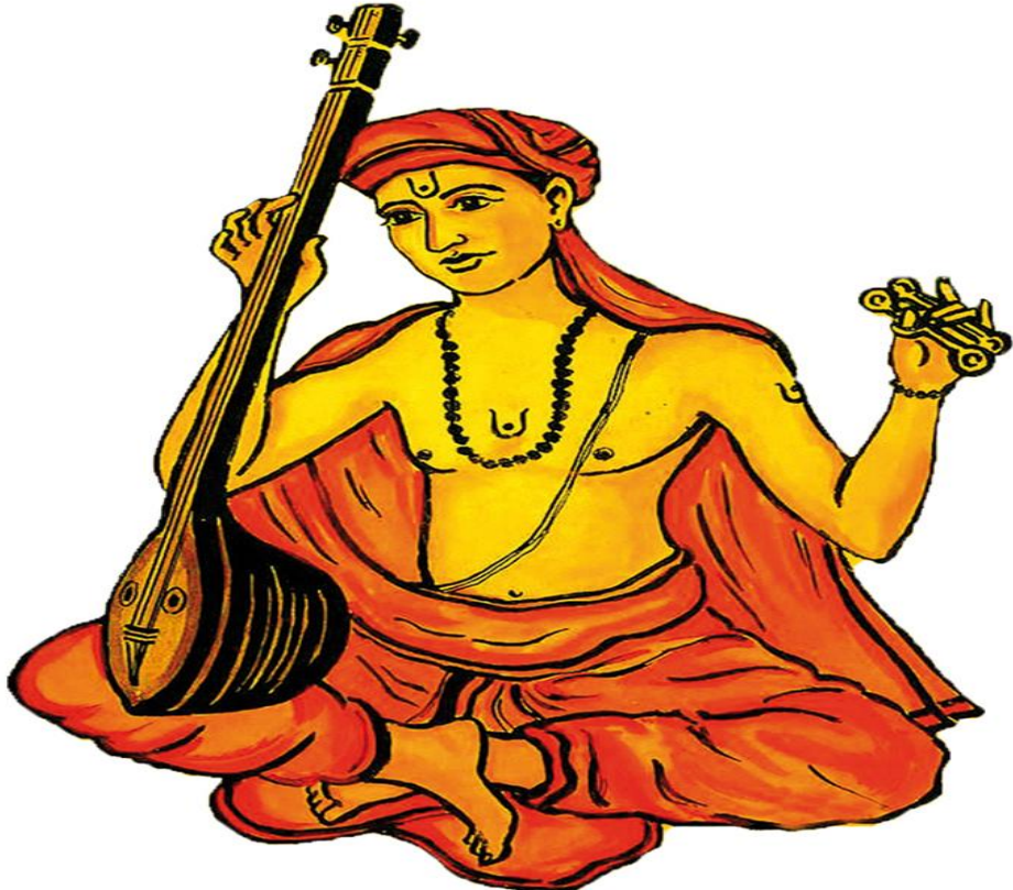
St. Thyagaraja (1767 – 1847)