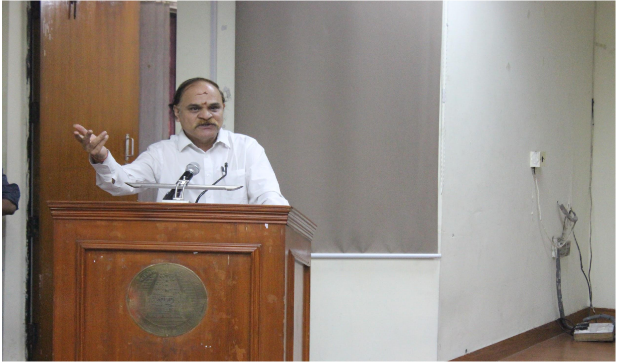
ప్రసంగిస్తున్న ఢిల్లీ జిల్లా న్యాయమూర్తులు శ్రీ ఎ యస్ జయచంద్ర గారు .