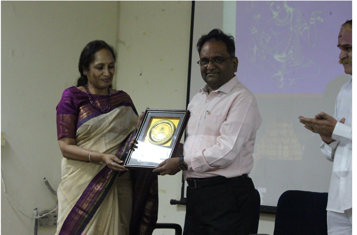
పూర్వ జాతీయ సమాచార కమిషనరు ఆచార్య శ్రీ మాడభూషి శ్రీధరాచార్యులు గారికి జ్ఞాపిక అందజేస్తున్న